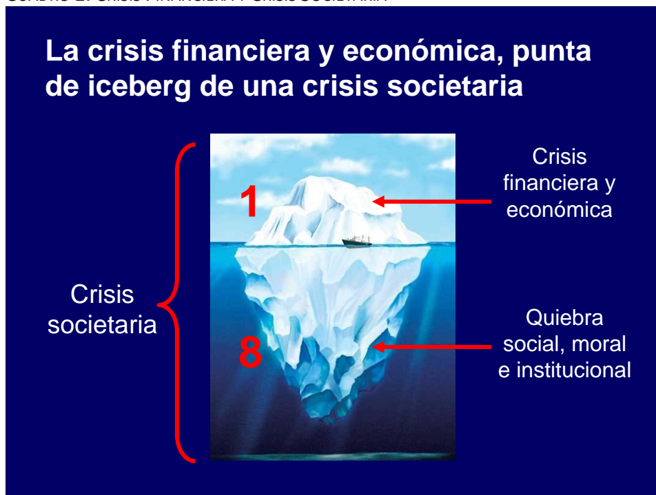
CUADRO 1. CRISIS FINANCIERA Y CRISIS SOCIETARIA

En un anterior y largo artículo aparecido en la revista electrónica: “Gobernanza”, señalaba que la actual crisis económica en Europea es claramente una crisis societaria, del conjunto de la sociedad, que tiene dos componentes: la crisis financiera que constituye tan sólo la punta del iceberg de la crisis societaria, y la quiebra social, moral e institucional y de gobernación que constituye las ocho partes escondidas del iceberg, y que son la causa de la crisis financiera.