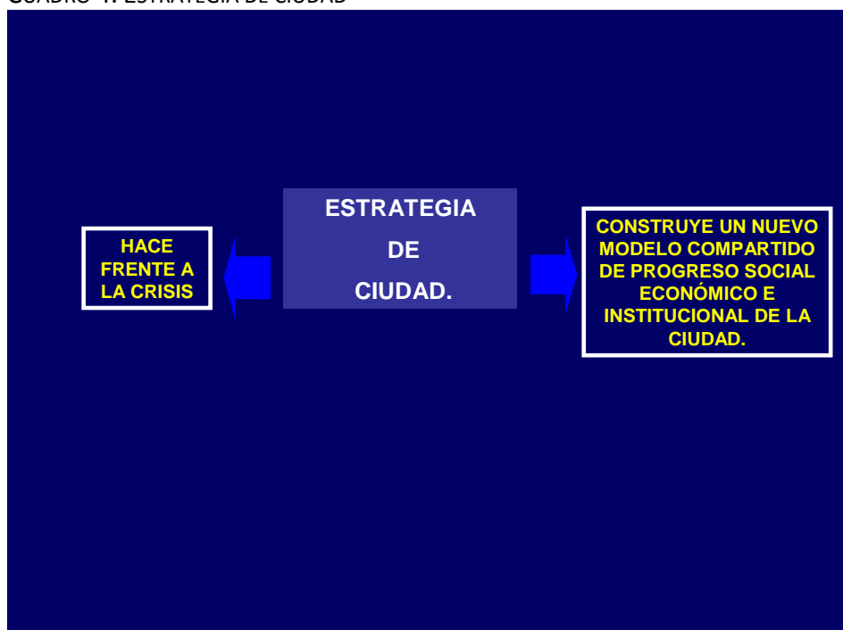
CUADRO 4. ESTRATEGIA DE CIUDAD

A los gobiernos locales ante la crisis de sus haciendas locales se les presentan dos alternativas. Una contraerse, reducir al mínimo la actuación de los gobiernos locales y de la ciudad, y esperar que se despeje su entorno de las grandes turbulencias que lo afectan. Otros por el contrario, afrontan la crisis para prepararse para un futuro en el que consigan avanzar en cohesión social y en competitividad económica y tecnológica. Ante el crecimiento de las necesidades y desafíos sociales consecuencia del gran cambio societario que comporta la crisis, y a pesar de la necesidad de reducir los déficits de las haciendas locales, los ayuntamientos más dinámicos convocan al conjunto de la sociedad civil para llevar a cabo una estrategia compartida, es decir un plan estratégico, que involucre a todos para abordar los principales retos que plantea la crisis, y sentar las bases de un nuevo desarrollo económico y social.