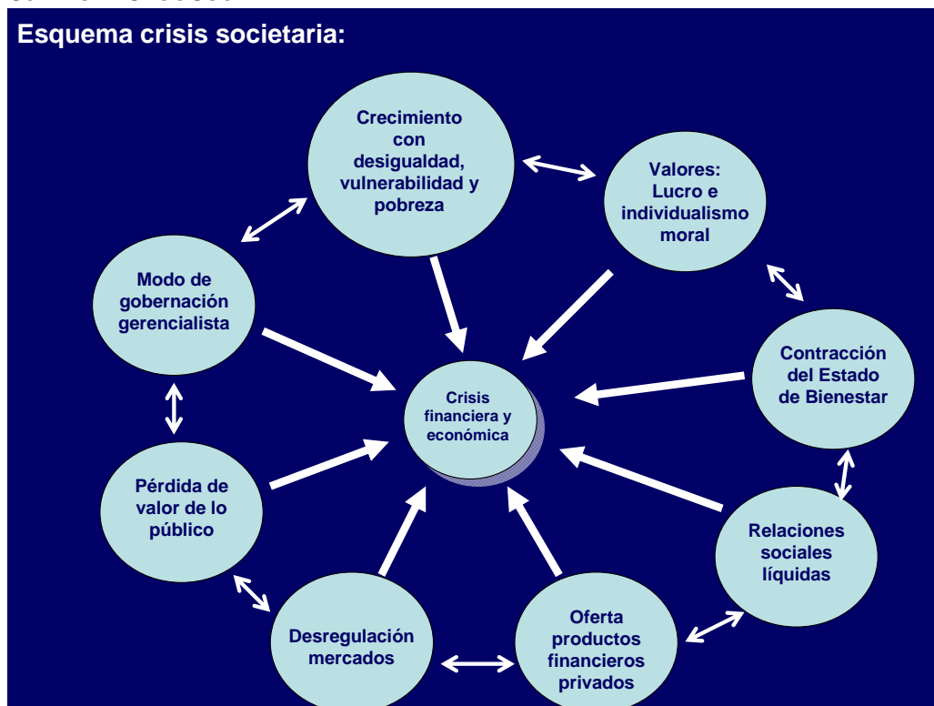
CUADRO 2. CRISIS SOCIETARIA